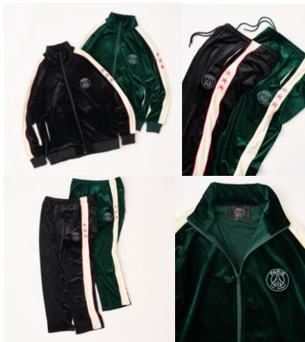
<ベロアセットアップ> トップス ¥24,200(税込) パンツ ¥17,600(税込)

光沢感と柔らかな肌触りが魅力的なベロア素材を使用したトラックジャケット。クラシックなデザインに、上品でラグジュアリーな質感をプラスした一着。スポーティーさとシックな印象が絶妙に融合し、カジュアルコーディネートにアクセントを与えます。