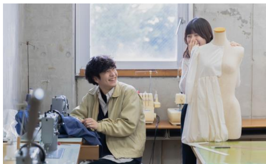
▲ 卒業制作作業風景 ▲