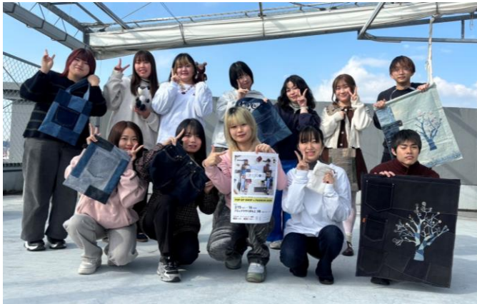
▲ ファッションデザイン科2年生の皆さん ▲

アミュプラザくまもと3Fのぼうけんの杜付近にて、熊本デザイン専門学校ファッションデザイン科2年生、13名の卒業制作作品の発表会を行います。今年の発表会は、クリエイティブ専攻コースによるファッションショーに加え、ファッションビジネス専攻コースによるPOP UP SHOPを展開し、作品の販売も行います。全ての作品はアミュプラザくまもとのイベントで学生と回収した古着を使用。環境に配慮してアップサイクルした、世界に一つしかないオリジナル作品を是非ご覧ください。