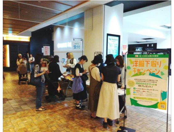
▲ 昨年10月に実施したイベントの様子▲