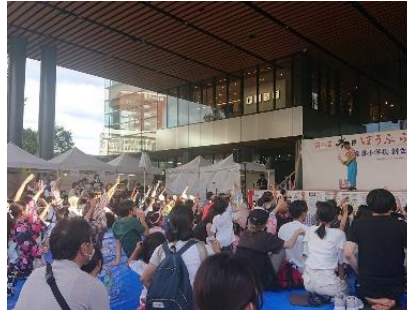
春日ぼうぶらまつり